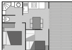
Chalet "Eden" 25m 2 + terrasse couverte