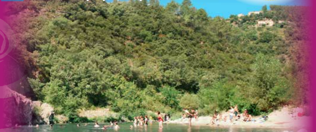
Rivière à 1km

Altitude du camping 200 m Gare SNCF la plus proche : Montélimar à 64 km Arrêt bus la plus proche : Joyeuse à 5 km