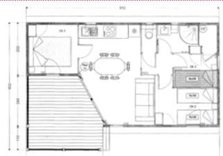
Chalet "Rêve" 3 chambres 35m 2 + terrasse couverte 12m 2

Sa terrasse extérieure Salon de jardin et ses 2 chaises longues