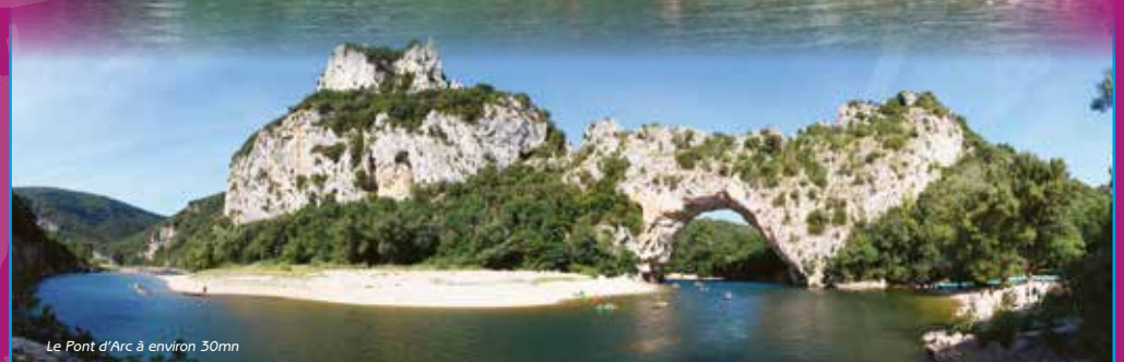
Le Pont d'Arc à environ 30mn